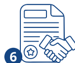
6 Жумушка алуу